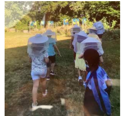
Ausflug zur Imkerin